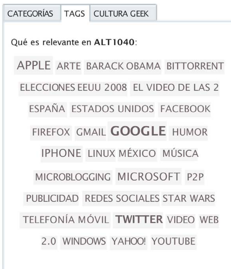
Figura 2. Tag cloud o nube de palabras de Alt1040.com.

Uno no debe desperdiciar ni un instante ante la novedad de un fenómeno para ir directo a sus fauces. La mordida de Alt1040.com tiene un par de colmillos grandes en su tag cloud 38 , dice: