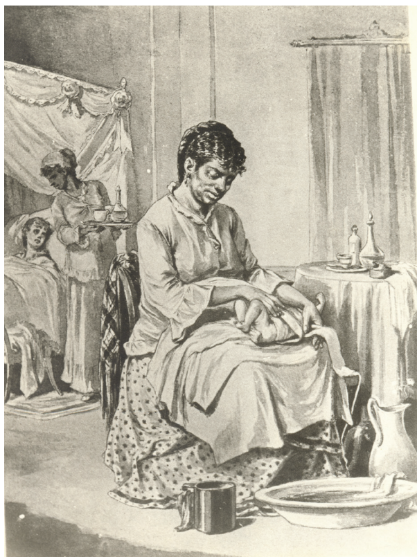
Figura 6. Víctor Patricio de Landaluze. La Partera , 1881. Litografía Figura 6. Víctor Patricio de Landaluze. The Partera , 1881. Lithography.

El artista español obtiene lauros como ilustrador con Tipos y Costumbres de la Isla de Cuba , de 1881, compilación de artículos escritos por los mejores autores costumbristas de aquella época, en un formato de álbum ilustrado, catalogado como uno de los trabajos más significativos dentro de la línea costumbrista en Cuba. La obra reflejaba a distintos tipos populares, aquellos que circulaban por la localidad y le daban vida en hormigueante ajetreo. Como expresara el historiador chileno Miguel Rojas Mix al analizar los tipos populares americanos, el principal protagonista de estas escenas pictóricas es el pueblo, que llega a asumir una fisonomía icónica significada como indio o mestizo, y que se mantiene largo tiempo sin modificación (Rojas, 1978). Allí, la mujer negra se transmutaba en la partera (Fig. 6) o la vendedora de frutas (Fig. 7); lo cual permite reconocer las alternativas de subsistencia económica de la mujer, quien tenía en muchas ocasiones a su cargo el mantenimiento de sus demás familiares cercanos