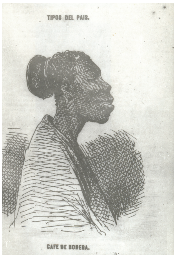
Figura 4. Víctor Patricio de Landaluze, Café de bodega , 1870.