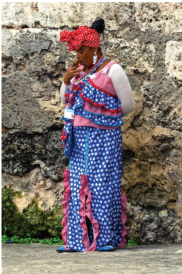
Figura 12. Osmeý Milián. Sin título , 2018. Fotografía digital

Figure 12. Osmeý Milián. Untitled , 2018. Digital photography