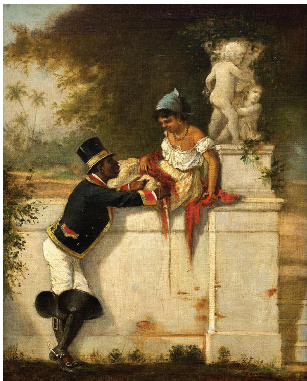
Figura 9. Víctor Patricio de Landaluze. Escena galante , s/f. Museo Nacional de Bellas Artes, La Habana. Óleo sobre tela; 36 x 28 cm.

Figure 9. Víctor Patricio de Landaluze. Gallant scene , s/f. National Museum of Fine Arts, Havana. Oil on fabric; 36 x 28 cm.