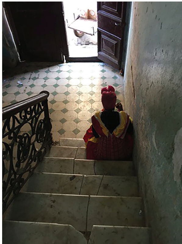
Figura 13. Osmany Suárez. Economías íntimas , 2018. Fotografía digital

Figure 12. Osmeý Milián. Untitled , 2018. Digital photography