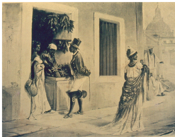
Figura 7. Víctor Patricio de Landaluze. El puesto de frutas , 1881. Litografía Figure 7. Víctor Patricio de Landaluze. The fruit stand , 1881. Lithography

A diferencia de la negra, el tratamiento de la mulata en el álbum y en otras obras del pintor, evidencia claras connotaciones de atracción como objeto de representación, y es justo ahí donde esa línea divisoria podía ser, de algún modo, transgredida: ella revelaba mezclas étnicas, que la ubicaban en cierta ambigüedad racial entre la negra y la criolla blanca, y en consecuencia, sujeta también a la subordinación social y genérica. Se trataba, para los ojos de Landaluze, de una mujer gozosa y alegre, siempre sensual y complaciente, desprejuiciada y coqueta, presta