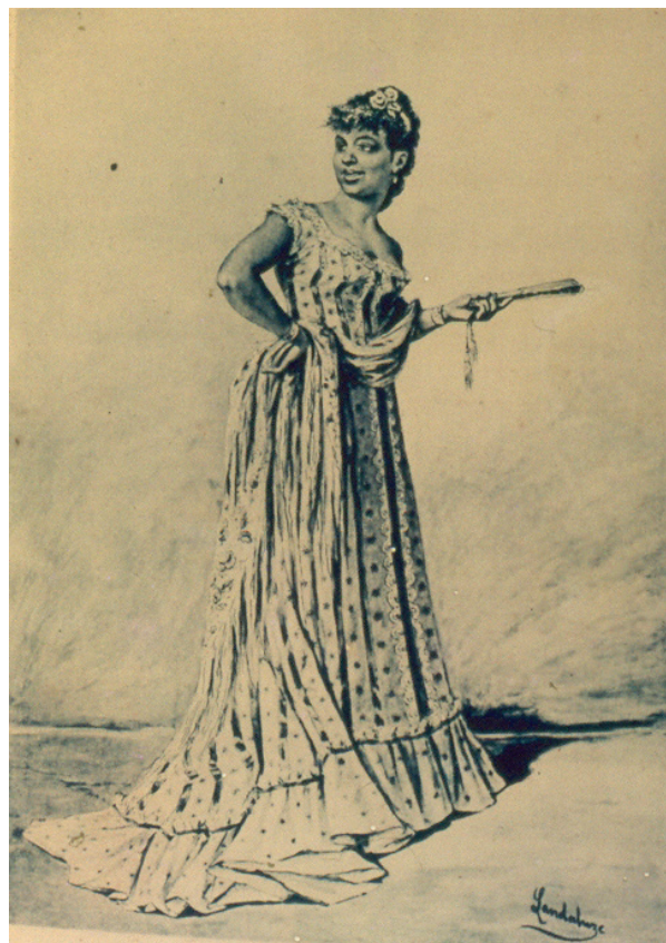
Figura 11. Víctor Patricio de Landaluze. Mulata de rumbo , 1881. Litografía

Cabría preguntarnos si la mulata del XIX, como cuerpo sexuado en el que se inscribe una vivencia particular, porta la experiencia de un sistema representativo de identidades genérico-sexuales racializadas y de clase, iniciado con la obra de Landaluze como tipificación de la alteridad, para convertirse hoy en un modelo prototípico-idealizado de fémina cubana. La complejidad de la