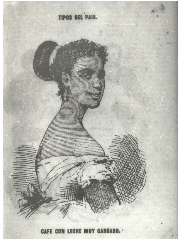
Figura 3. Víctor Patricio de Landaluze, Café con leche muy cargado , 1870.