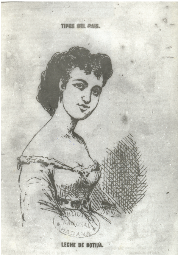
Figura 2. Víctor Patricio de Landaluze, Leche de botija , 1870.

“Café de Bodega” (Fig. 4) será el modelo común de la negra en otras obras del autor, como expresión de su estado de subalternidad. El artista apela, entre otras cosas, a su “poca gracia” o disposición en otros escenarios sociales. Sus cuerpos eran ridiculizados en tanto excesivamente gruesos o delgados, y la cabeza mostraba evidentes deformaciones, donde la nariz y los labios sobresalían en esta intencionalidad grotesca de abordar a las féminas negras. Así, marcado por su visión clasista, el pintor esta-