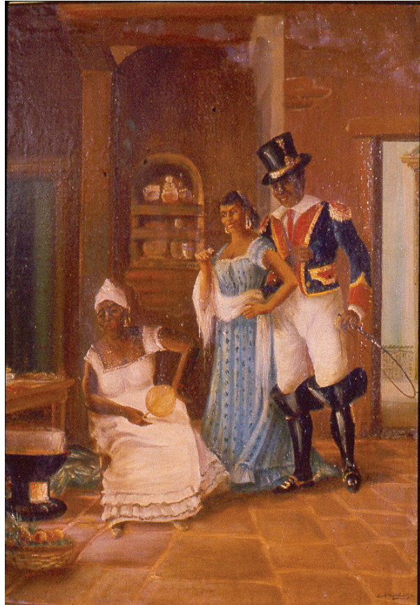
Figura 8. Víctor Patricio de Landaluze. Bolos de Belén , s/f. Museo de la Ciudad de La Habana. Óleo sobre tela; 52 x 44.5 cm.

Estas obras de Landaluze no revelan a una mujer hogareña, recatada y sumisa, lo cual sí abordó cuando de representar a la campesina blanca se trataba. En cambio, la mulata aparece cual mujer orgullosa de su condición