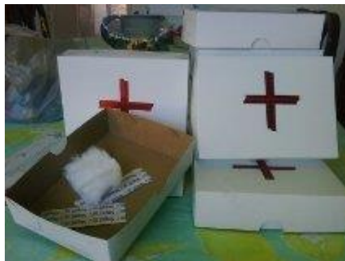
Material: Botiquín para curar heridas