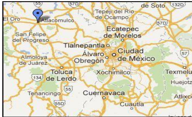
Figura 1. Mapa de Atacomulco de Fabela, Estado de México (Ayuntamiento de Atacomulco, 2012)

Atacomulco cuenta con una superficie territorial poligonal de 258.74 km 2 que representan 1.19% del total del territorio estatal y 8.90% de la Región I del Estado de México. La temperatura máxima promedio es de 19.9° C., en tanto que la mínima es de 7.4° C., siendo la temperatura media anual de 13.8° C (Ayuntamiento de Atacomulco, 2012).