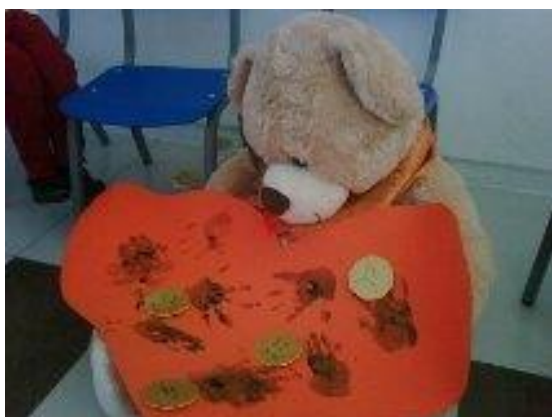
Los niños recuperan las emociones