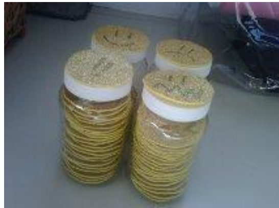
Material: Caritas con emociones