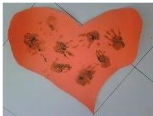
Corazón del pirata Max