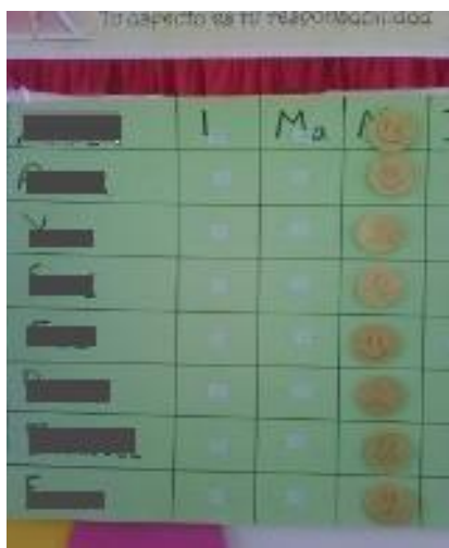
Panel para colocar las emociones