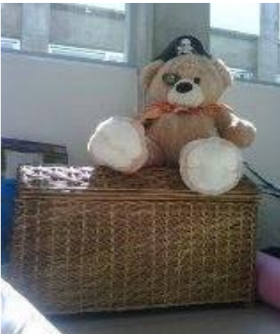
Pirata Max y el cofre del tesoro