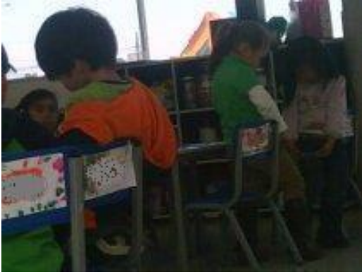
Observación en el salón de clase