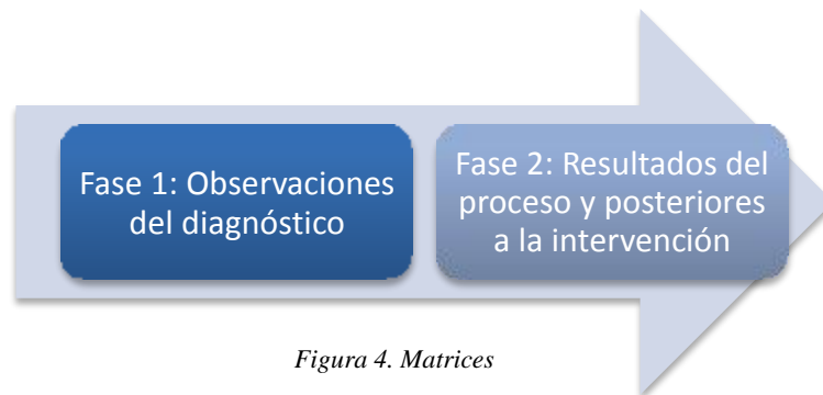
Figura 4. Matrices

Se realizaron matrices por cada uno de los niños ya que se consideró que eran las necesarias para la construcción de los resultados. Es importante mencionar que cada uno de los nombres de los niños fueron cambiados para cuidar el anonimato de los mismos. La matriz contiene los resultados por categoría, incluyendo subcategorías, diagnóstico y evaluación de la intervención. Los resultados integran las observaciones, apoyados por fragmentos de diálogos que se derivaron de la relación e interacción de los niños en cada una de las sesiones del taller, de las entrevistas y de la integración del análisis de las respuestas que los niños presentaron en las categorías observadas.