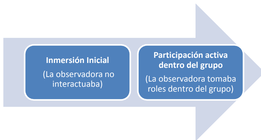
Figura 3. Etapas que conformaron la observación de los niños

Se realizaron 9 horas de observación dentro de las cuales la facilitadora fue teniendo varios roles. Durante la inmersión inicial la facilitadora estaba presente pero no interactuaba con el grupo. Después de un par de días de observación los niños comenzaron a incluirla en sus actividades y juegos (observación participante), hasta que la observadora se volvió una más del grupo, a veces jugando el rol de compañera de juegos o a veces de maestra, ya que los niños la invitaban a jugar y le hacían preguntas o le pedían ayuda (Hernández, Fernández y Baptista, 2010).