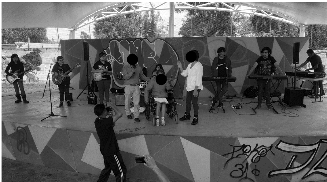
2 Presentación del colectivo «Raíces Soberanas» en el evento Verano Verde.