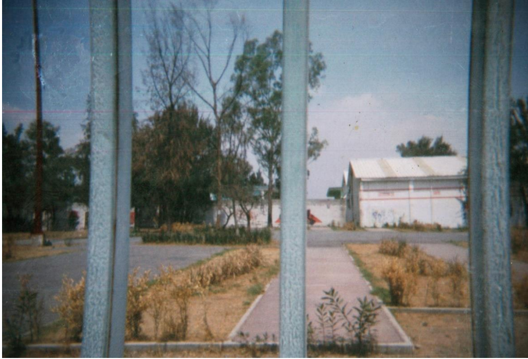
Fotografía 11. «Es parte del deportivo. Y esas rejas dan la impresión de estar en una jaula, y más porque tengo recuerdos de cuando me chiflan, cuando me dicen ‘ahí viene la güerita’». «Atrapados», Esmeralda, desocupada, 17 años.