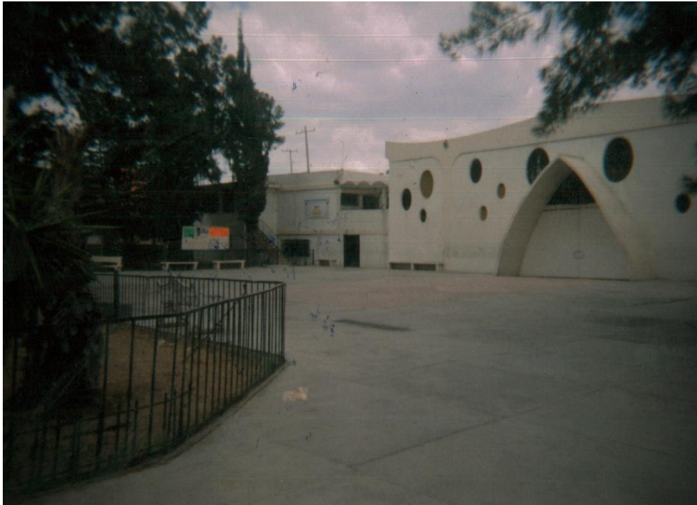
Fotografía 5. «Me gusta la iglesia porque dan clases de inglés. Todavía dan clases allí pero ya no voy. Es muy tranquilo allí». «La iglesia», Daniel, estudiante de secundaria, 14 años.