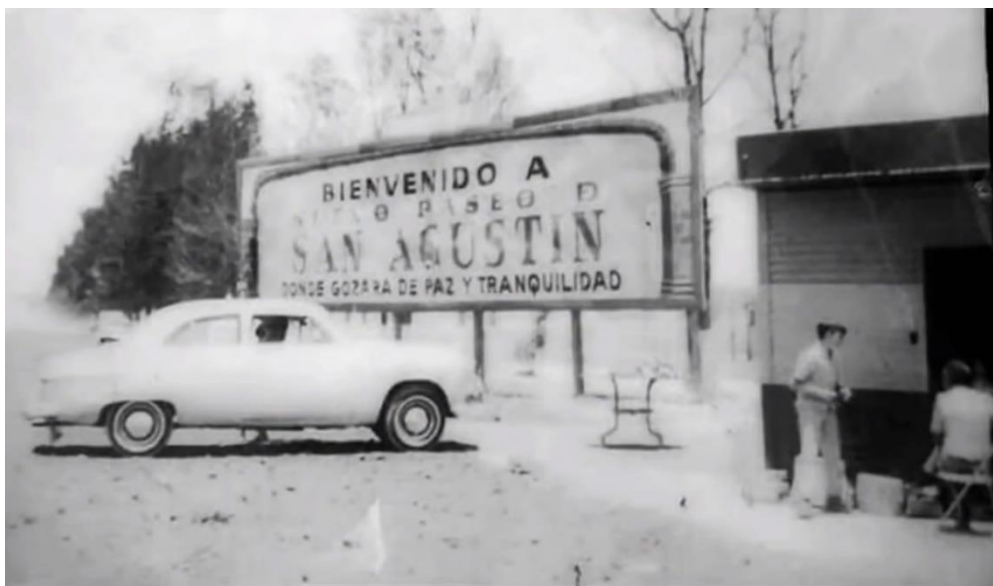
1«Donde gozará de paz y tranquilidad», fotografía facilitada por el anexo histórico del cronista de la colonia.

La permisividad de las autoridades locales, según la memoria popular, toleró el abuso de la fraccionadora hacia los colonos: la venta del mismo terreno a diferentes personas era frecuente y la promesa de urbanización por parte de la empresa fue incumplida. Sin embargo, para muchos colonos, migrantes de la Ciudad de México y de zonas rurales empobrecidas, vivir aquí representó una oportunidad de contar con un mínimo de seguridad y de progreso. Esto permitió que se desarrollara la voluntad en la gente de aquí para comprometerse en las actividades de mejoramiento de las condiciones de vida en la comunidad 7 . Así, los servicios urbanos fueron prioridad dentro de la comunidad desde un comienzo. La electricidad, alcantarillado, recolección de basura y agua se convirtieron en demandas cotidianas. «Era un lodazal, había llano, no había servicios, nos