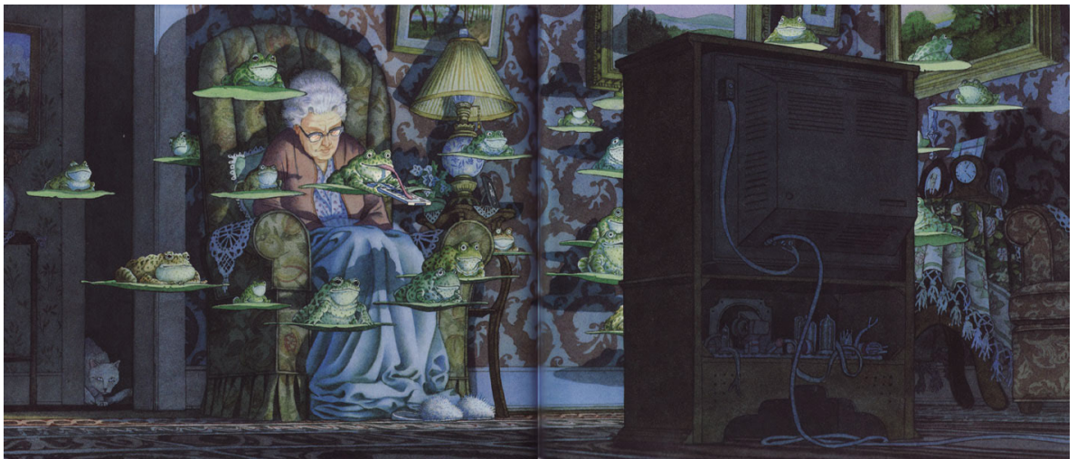
Figura 3. Las ranas ven televisión; David Weisner, Tuesday (Clarion Books, 1991); imagen tomada de la página: dito.areato.org/wp-content/uploads/2017/03/wiesner_tv.jpg .

hombrecito verde son las páginas lisas de un libro. No hay pretensión de apuntar a otra cosa más que a la materialidad de un formato; y aunque este personaje no entre en conflicto con su creador o nos hable de las complicaciones de la escritura de ficción, al cambiar las páginas nos demuestra que sabe en donde vive, se vuelve metaficcional y nos invita a entrar en su realidad. No hay algo que nos separe de él. Su locura es inherente a su ser y a su mundo, por eso nos hace reír.