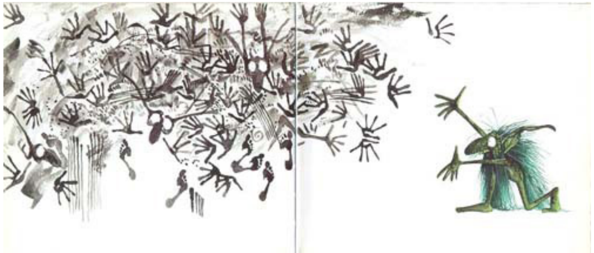
Figura 6. El artista Trucas; Juan Gedovius, Trucas (FCE, 2013); imagen tomada de la página: www.imaginaría.com.ar/wp-content/uploads/2010/02/12-Trucas-Mostrando.jpg

Cada espacio en blanco le permite así anticipar su próximo movimiento, dejar al lector con muchas expectativas y marcar la respiración de la mirada, atenta y ansiosa por saber qué ocurrirá a continuación pero condenada a la espera. Como en los trucos de magia, las páginas desprovistas de color son el telón o la manta que esconde la siguiente sorpresa, lo inesperado, sin ofrecernos explicaciones, porque ningún mago expone sus secretos. El monstruo es tan escurridizo como un naipe apareciendo de repente en la cartera de un espectador.