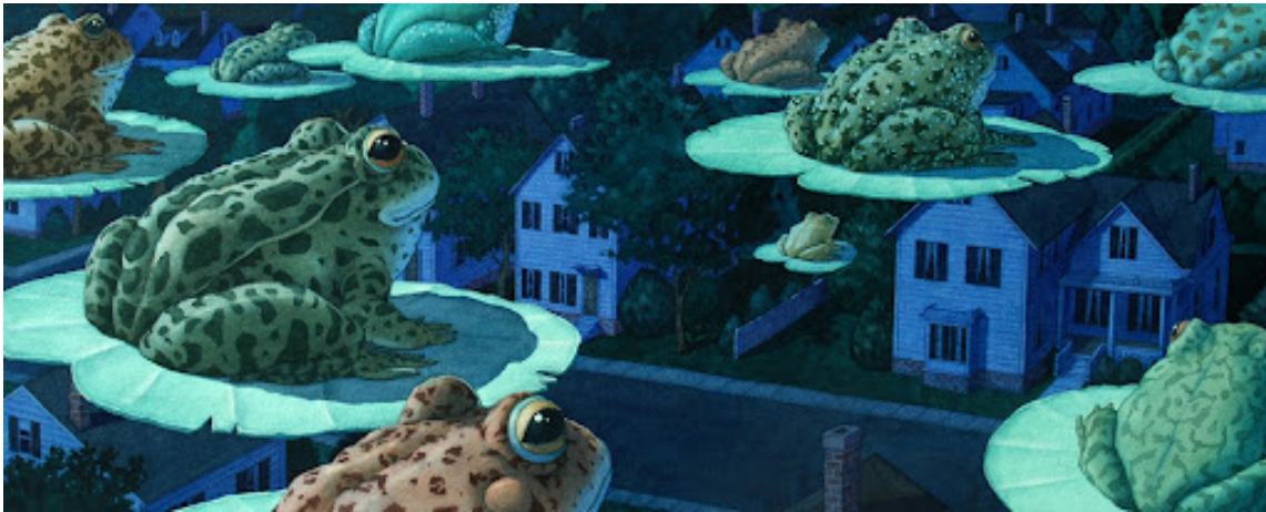
Figura 5. Las ranas volando; David Wiesner, Tuesday (Clarion Books, 1991); imagen tomada de la página: www.davidwiesner.com .

muy cerca del piso, los close-up , las tomas a través de las ventanas abiertas, y la convivencia entre la luz de las casas y la oscuridad estructuran nuestra mirada y juegan con nuestras expectativas de linealidad.