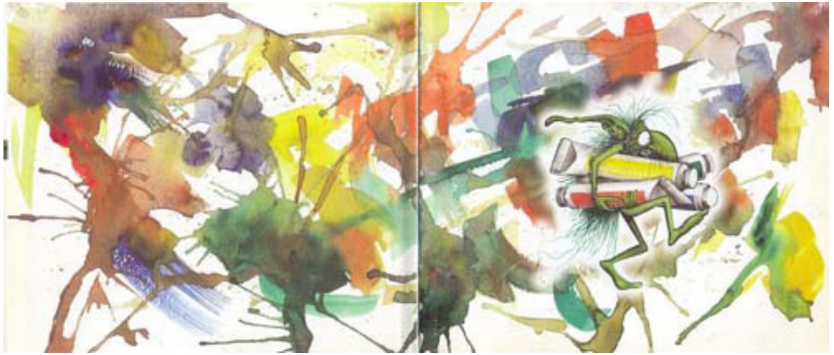
Figura 2. Trucas jugando con sus colores; Juan Gedovius, Trucas (FCE, 2013); imagen tomada de la página: www.imaginaria.com.ar/wp-content/uploads/2010/02/02-Trucas-Manchas.jpg .

El juego de las escalas, que lo muestran mucho más pequeño que los tubos de pintura o la mano de su madre, también refuerzan su comicidad. Asimismo, como cada una de sus apariciones se despliega en dos páginas opuestas, siempre en un fondo blanco, los colores que lo componen resaltan muchísimo más y la secuencia narrativa se vuelve más tranquila, en consonancia con sus cambios emocionantes y con los pasos que da. A pesar de la simplicidad del entorno, cada matiz está ahí por una razón y dice muchísimo con cada gesto.