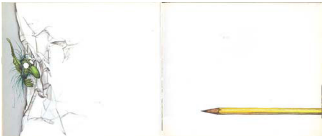
Figura 4. Trucas y la cola del dragón; Juan Gedovius, Trucas (FCE, 2013); imagen tomada de la página: www.imaginaría.com.ar/wp-content/uploads/2010/02/06-Trucas-Asomado.jpg .

La situación inicial, su travesura multicolor, se reitera al final con su pintura de huellas negras y el círculo también se cierra para provocarnos una gran sonrisa. Como si estuviéramos frente al truco de un gran mago, observamos encantados la forma en la que Trucas resuelve su problema para salirse con la suya una vez más. El presagio de la portada, su cara chistosa que nos observa extrañado, se cumple: nunca dejamos de acompañarlo y de asombrarnos con él en este escenario blanco lleno de dragones con colas en forma de lápiz (véase la figura 4).