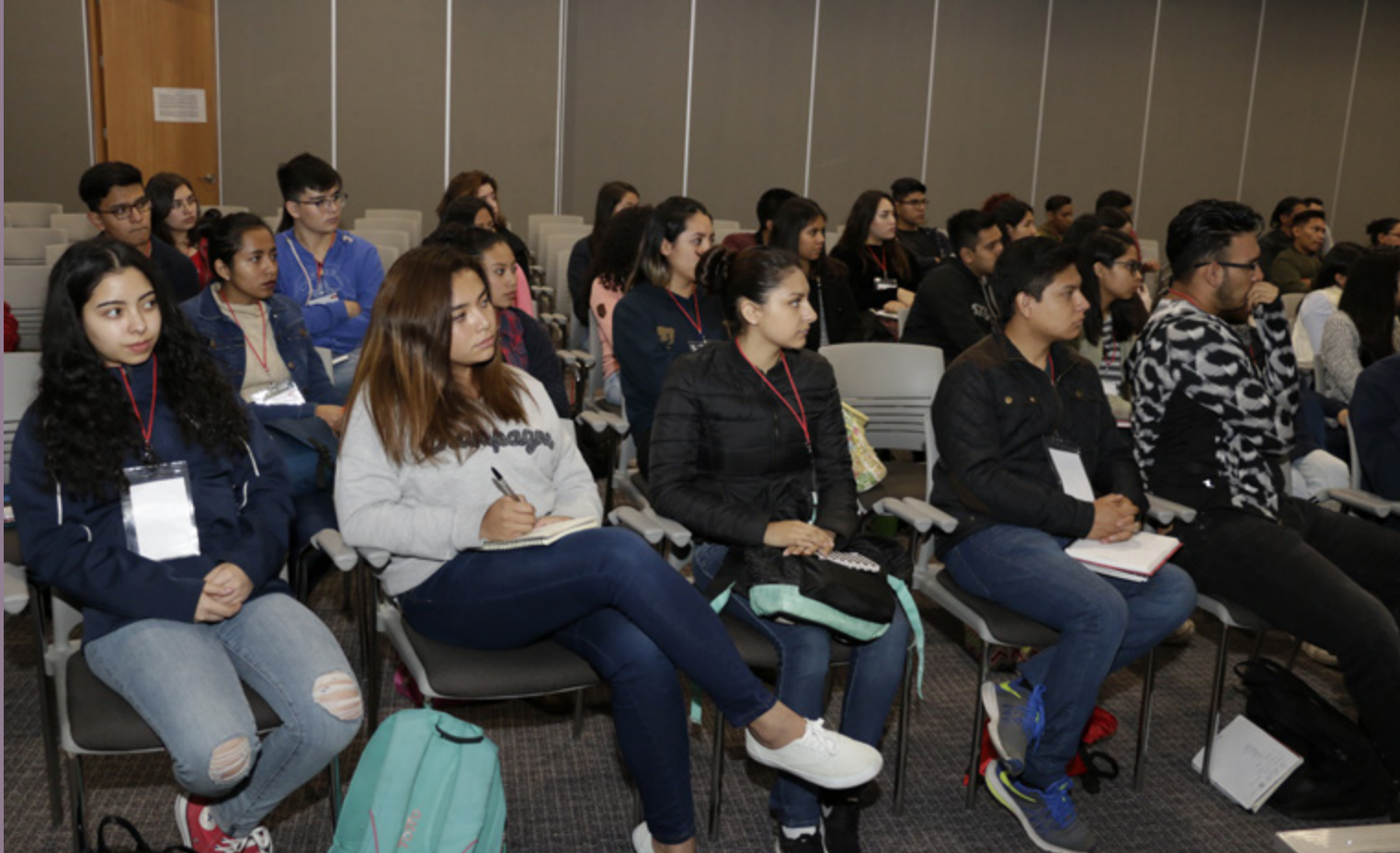
Integrantes de la generación 2018 del programa Si Quieres, ¡Puedes!