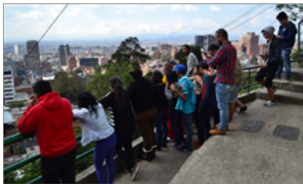
Figura 2. Exploración del barrio en la asignatura “Estado, sociedad y cultura”.