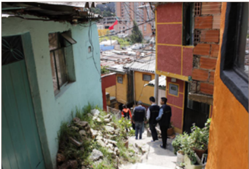
Figura 6. Recorrido por uno de los callejones de Juan XXIII.