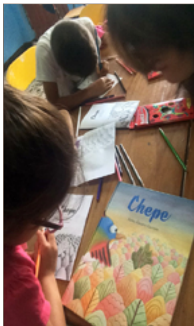
Figura 5. Taller de creación con los niños del barrio a partir de una de las historias de los libros de la colección.