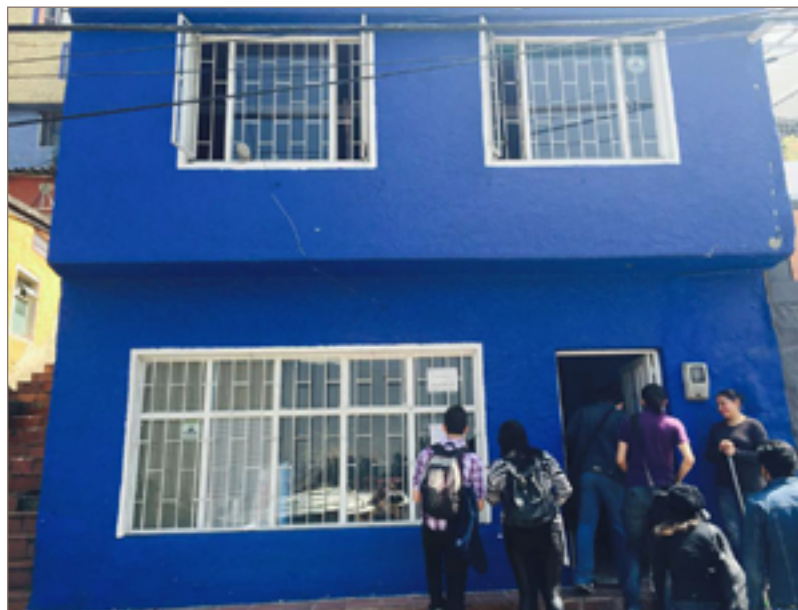
Figura 4. Fachada de la Casa Azul.

con el diálogo al interior de los espacios comunitarios, la interacción de los habitantes con su entorno, el desarrollo cultural y los espacios de esparcimiento y educación. Fue durante ese proceso de investigación que los mismos alumnos encontraron que “Casa Azul” es el espacio idóneo para encaminar su proyecto. La casa ya no debe ser más un lugar para guardar libros o realizar consultas esporádicas, sino una biblioteca activa, con una particular colección de libros dirigidos a niños y jóvenes. Un sitio dinámico que le ofrezca a la comunidad actividades escolares y extra escolares de formación cultural, artística y personal; en donde los esfuerzos estén dirigidos hacia la construcción del tejido social, los valores, la identidad y la igualdad de oportunidades. (figuras 4 y 5)