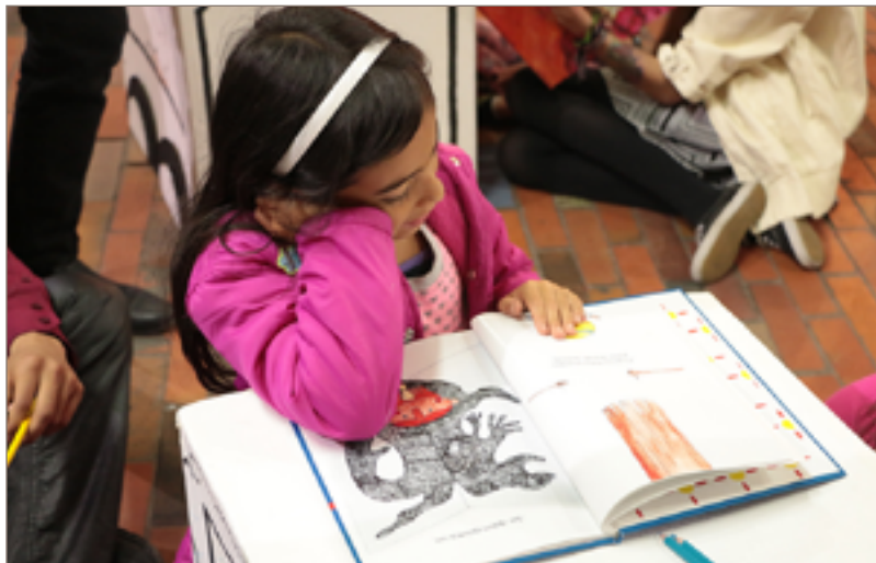
Figura 11. Niña del barrio leyendo uno de los libros de la colección.

La biblioteca cuenta con un salón de actividades que se habilita para cursos, conferencias, lectura y talleres. Los estudiantes de diseño gráfico ya han dictado talleres creados por ellos mismos. Parte de la proyección de “Reencuentro en la Casa Azul” se fundamenta en diseñar ac-