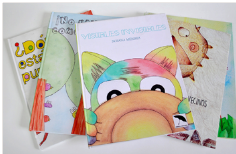
Figura 1. Algunos de los libros hechos por los estudiantes de 3er semestre.

La Facultad de Diseño Gráfico, acogiendo a esta visión, desarrolla ejercicios de proyección social en donde los estudiantes, a partir de procesos de investigación y reflexión, proponen soluciones a problemáticas específicas de una comunidad local. Desde el planteamiento del programa curricular de Diseño Gráfico, 3er semestre trabaja su proyecto final dentro de un módulo denominado institucionalmente como “Diseño y Sociedad”, el cual tiene como objetivo que los estudiantes busquen desde su posición de comunicadores visuales formas de beneficiar a la sociedad, identificando necesidades muy particulares a través de un contacto más personal con la gente para la cual diseñan y, de este modo, se propongan soluciones más efectivas, empáticas y cercanas (Documento Maestro, lineamientos curriculares, Facultad de Diseño Gráfico, Universidad Santo Tomás 2012). Más allá de visualizarlo como un proyecto académico, se debe entender como una oportunidad para aportar al cambio social, lo que conllevará al mejoramiento de un país con marcados problemas de equidad socioeconómica y cultural.