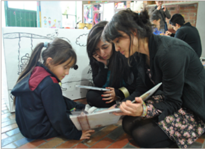
Figura 9. Actividad de lectura con los niños del barrio.