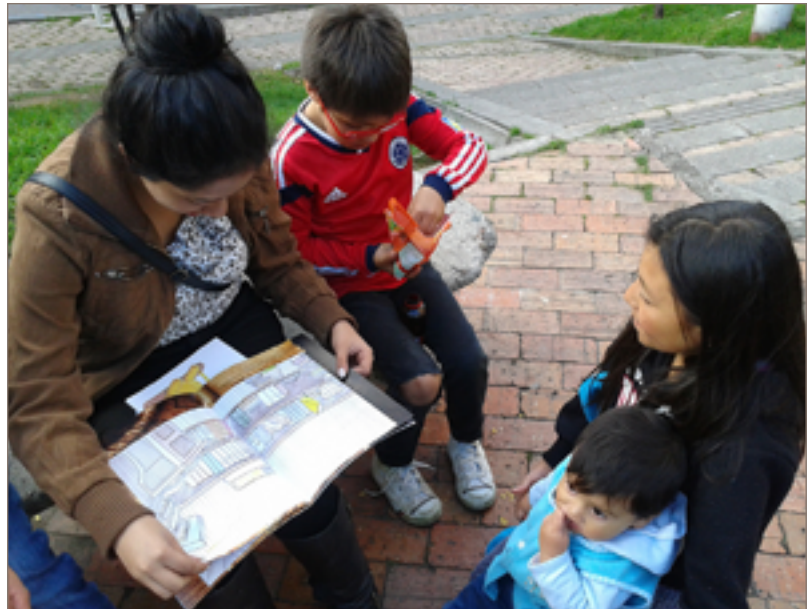
Figura 10. Actividad de lectura con los niños del barrio.

ducto del trabajo será visto, leído, usado y disfrutado por una comunidad. Así que la conciencia de impacto se hace real y, en consecuencia, los estudiantes comienzan a con-