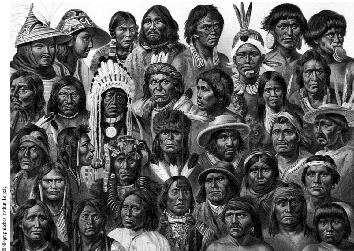
Bibliographisches Institut, Leipzig