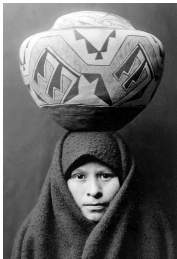
Edward S. Curtis

La centralidad en el estudio de lo específico a partir de un enfoque cualitativo ha provocado que la antropología sea reconocida por otras ciencias sociales como tribal. Esta imagen es alimentada por enfoques cuantitativos, cuya supremacía y legitimidad en las últimas décadas es mantenida por quienes sólo consideran que un análisis es válido mientras pueda ser