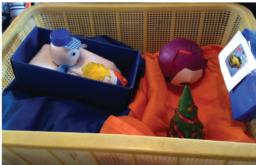
■ FIGURA 1. Guardería de los huevos bebés