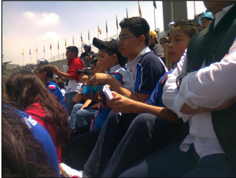
Señor viendo el partido y dando de comer a su hijo. Estadio de Ciudad Universitaria. 26 de agosto de 2012.

Dentro de la cabecera, es común ver que llegue una mujer integrante de la porra sin acompañante interesada por el partido y las acciones del mismo. Mientras que en la parte de general o plateas es menos común verlas. De hecho, puede recibir miradas desaprobatorias o de intriga al no entender los demás aficionados qué hace sentada en un estadio sin la compañía de un hombre o de más personas. En la mayoría de las ocasiones las mujeres que van a esta sección del estadio, lo hacen para acompañar a su pareja, a sus hijos o amigos y parece que el rol que juegan dentro de la tribuna es un rol pasivo, de solo observar sin interactuar o tener reacciones frente a las acciones del partido.