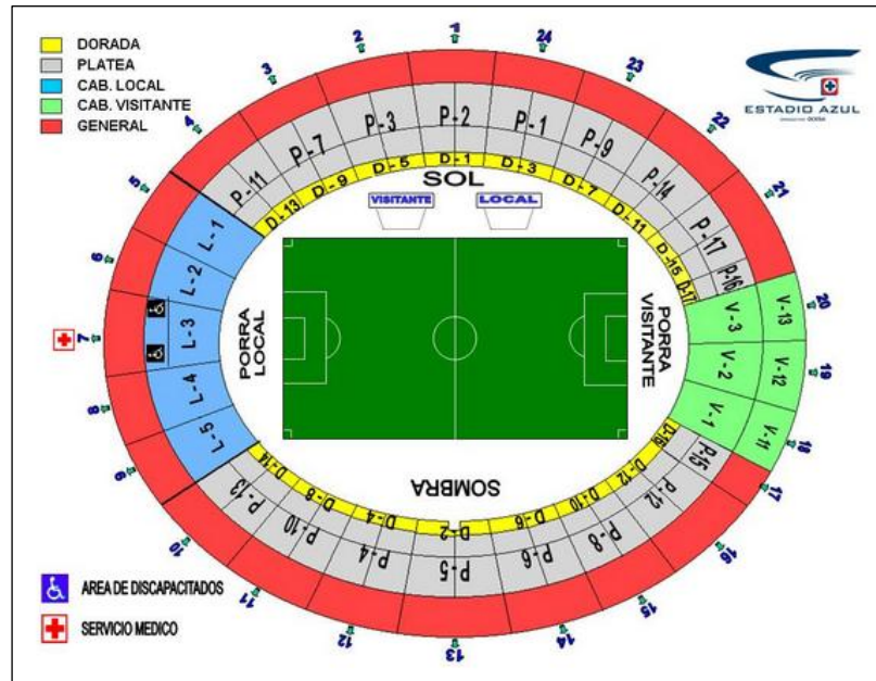
Estadio Azul. Ciudad de México.

Para los partidos contra los equipos con mayor rivalidad, Pumas, América y Chivas o cuando los partidos son importantes como semifinales o finales, las diferentes agrupaciones de aficionados organizan una caravana desde puntos cercanos al estadio, las estaciones del metro San Pedro de los Pinos y Patriotismo. Aunque es un evento mayormente organizado por La Sangre Azul, en el punto se reúnen integrantes de diferentes porras o aficionados que van solamente por ese partido.