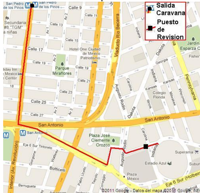
Mapa modificado por Mónica de la Vega Carregha, 2011.

En el camino es común que algún despistado del equipo contrario cruce alguna de las calles y que los de la porra Azul lo vean. Le chiflan y le gritan insultos, especialmente a los fanáticos de América, Chivas y Pumas, en este caso es necesario que algún elemento de la policía escolte a los contrarios por otro camino. Al ir resguardados durante todo el camino por elementos de SSPDF es difícil que logre darse un pleito a golpes entre aficionados.