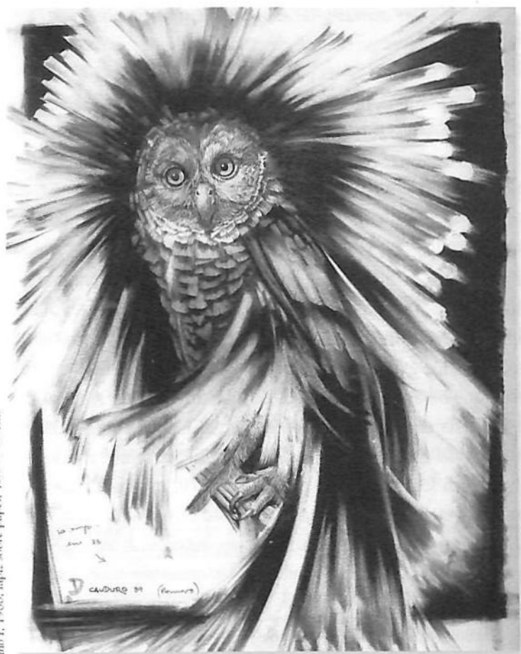
Bibho I., 1988. Lápiz sobre papel, 43,5 x 35 cm.

El miedo a la muerte no es sino una proyección del deseo de vivir y suele encerrar la trágica paradoja de que