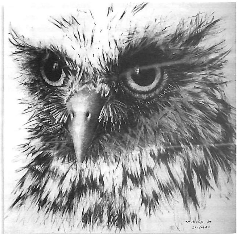
Cara de búho, 1989, lápiz sobre papel, 43.5 x 35 cm.

muerte es una realidad en cuanto horizonte vital, ya que nos sabemos mortales. La muerte de una persona cercana o la proximidad de nuestra propia muerte por vejez, enfermedad o accidente, pueden constituirse en una situación límite que nos ayuda a contrastar la realidad de nuestra vida con el hecho de su fragilidad. Para este pensador alemán, las situaciones límite son una alarma, una luz roja, una señal que nos ayuda a saber que hay algo que nos concierne directamente a nosotros y que nos cuestiona el sentido