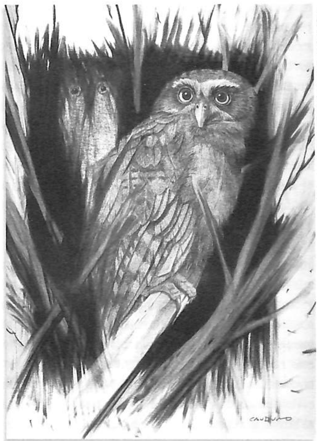
Buho y recobato, s/f, lápiz sobre papel, 43,5 x 35 cm.

En cualquier caso, hay una tendencia natural a evadir la muerte