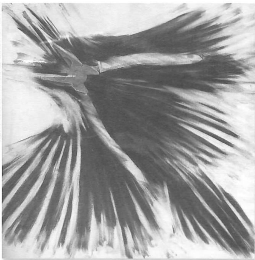
Reptiles herramientas, 1988, lápiz sobre papel, 35 x 43,5 cm.